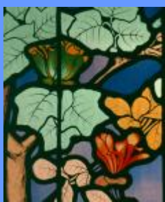
Jacques Gruber, vitrail de la Salle, détail

Sans réservation, 4,50€ / 4€ (réduit) / gratuit pour les moins de 12 ans