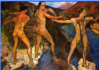
S. Valadon