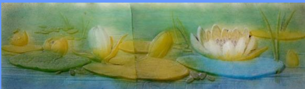
A. Walter et Daum Frères, éléments de jardinière Nénuphar.