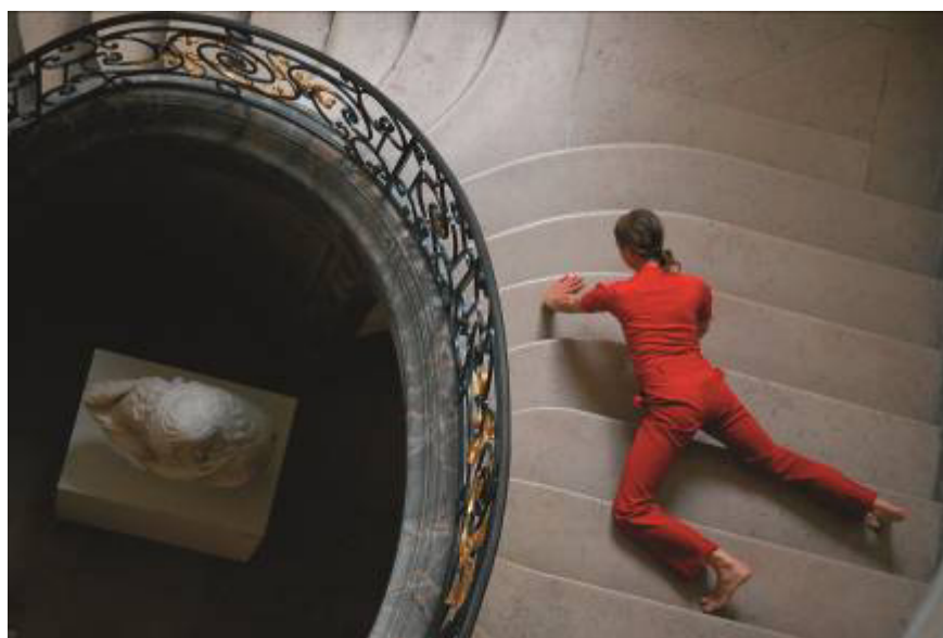
Visite dansée , 2007