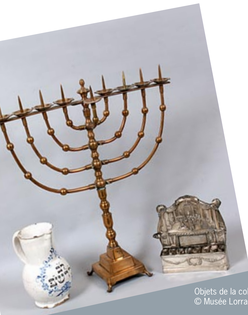
Objets de la collection Wiener, © Musée Lorrain, Nancy Photo : P.Buren / Ville de Nancy

25 personnes maximum. 61€ en plus du billet d'entrée. Réservation auprès du service des Publics : 03 83 32 99 42