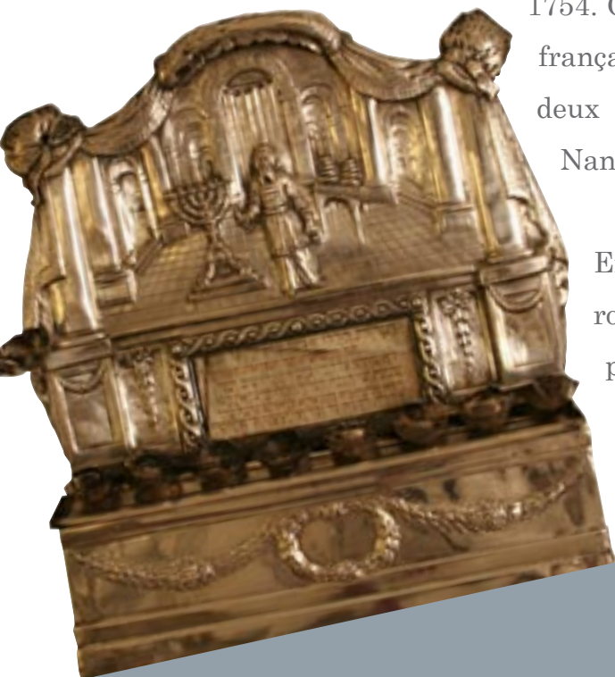
Lampe de Hanoukka , Lorraine (?), fin du 18 e siècle

En 1788, un concours est organisé par l'Académie royale de Metz sur «les moyens de rendre les Juifs plus heureux et plus utiles » où s'illustre le célèbre