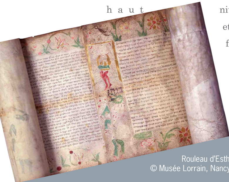
Rouleau d'Esther ( Megillah ), trouvé à Morrangé (57), 18 e siècle © Musée Lorrain, Nancy Photo : G.Mangin / Ville de Nancy

niveau réunit spécialistes internationaux et personnalités locales. Il interroge le fonds Wiener. Les organisateurs doivent aussi définir la scénographie d'un espace