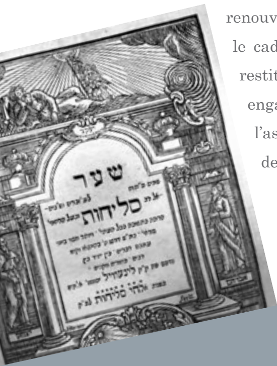
Frontispice d'un ouvrage de prières pénitentielles, Lunéville, impr. Brisac, 1799

L'exposition ne devait non plus se restreindre à une présentation renouvelée de l'extraordinaire collection Wiener étudiée dans le cadre du chantier des collections du Musée Lorrain, ni à la restitution de l'étude systématique de l'Inventaire général engagée depuis 2005 sur le patrimoine juif lorrain. Avec l'assistance précieuse du comité scientifique, il a été choisi de privilégier deux grands axes. Le premier, chronologique,