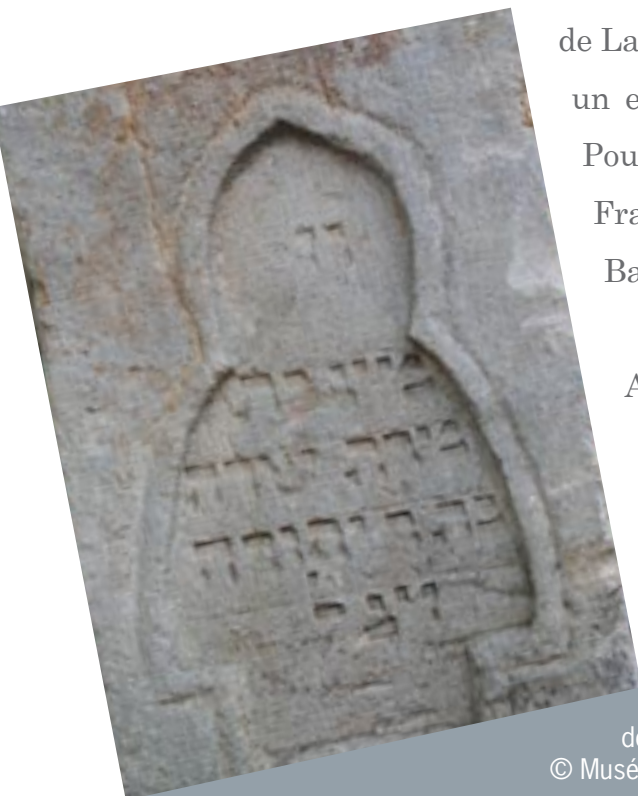
Stèle funéraire du 15 e siècle provenant du cimetière Juif de Laxou, trouvée en 1863.

Après un siècle d'absence totale dans la région, il faut attendre 1567 pour que quelques familles