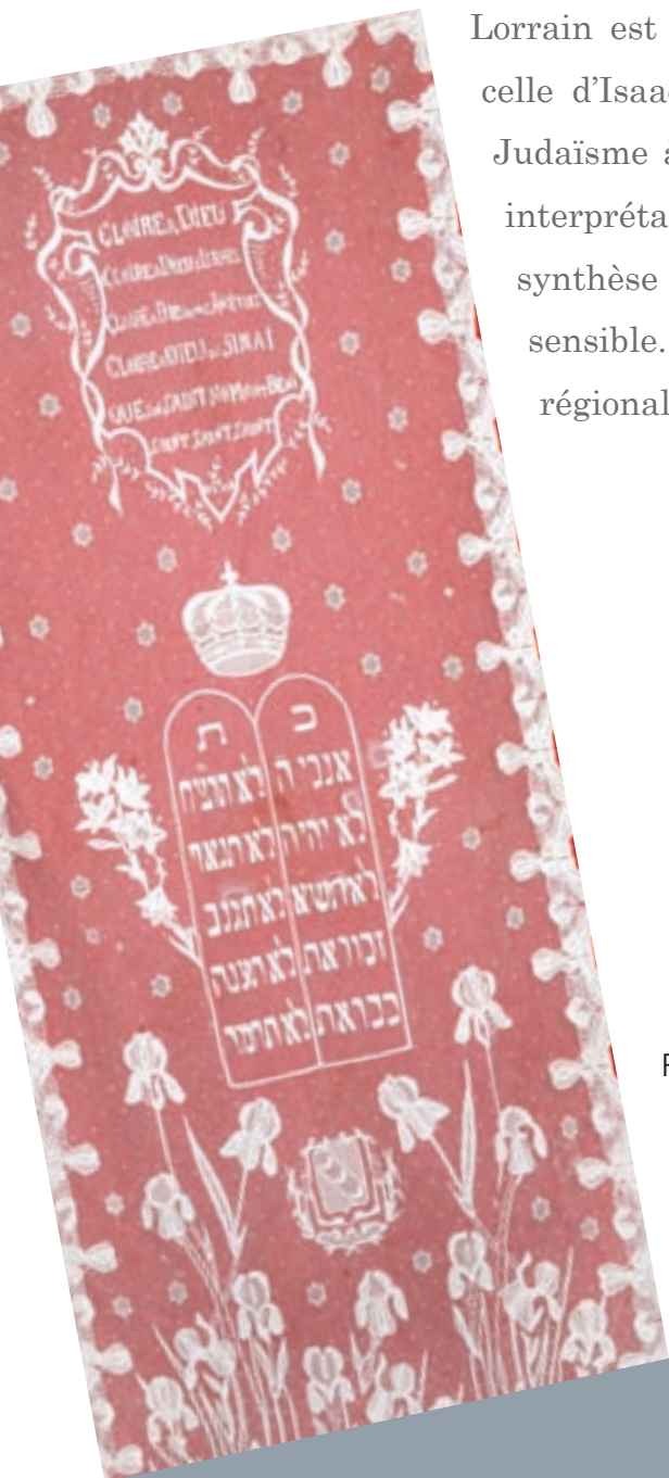
Rideau d'Arche sainte (Parokhet) provenant de la synagogue de Lunéville, broderie sur tulle, Lunéville, 1919

Lorrain est en effet la deuxième au niveau national, juste après celle d'Isaac Strauss conservée au Musée d'Art et d'Histoire du Judaïsme à Paris. Cette exposition dépasse pourtant une simple interprétation des richesses du musée. Elle ambitionne une synthèse des connaissances actuelles sur un sujet complexe et sensible. Le partenariat étroit du Musée Lorrain avec le Service régional de l'Inventaire confirme bien ce regard pluriel.