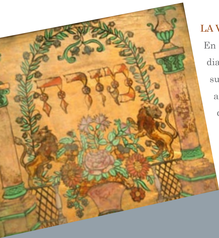
Mizrah, fixé sous verre, Est, 19 e siècle

En complément du récit historique, la lecture diachronique de l'exposition peut se centrer sur la vie juive et la pratique religieuse. C'est aussi à travers ce prisme de la transmission d'une tradition que se dévoile l'identité des communautés lorraines. L'idée est de montrer