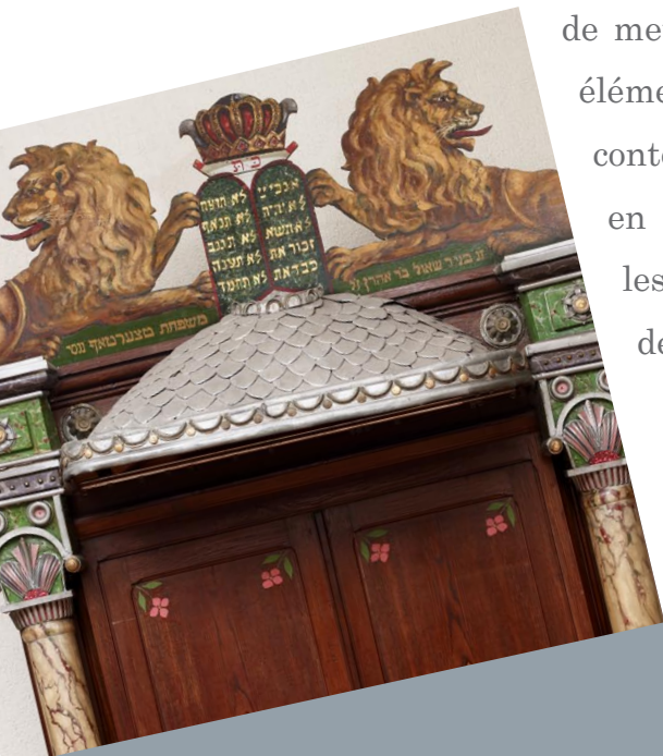
Arche sainte de l'oratoire de rite polonais inauguré en 1930 au 55, rue des Ponts à Nancy

de mettre en évidence les liens qui organisent les différents éléments patrimoniaux entre eux et les replacent dans un contexte géographique, historique et sociologique pour en faire ressortir les permanences, les particularités et les évolutions de la thématique examinée. Le résultat de ce travail d'étude du patrimoine et des collections