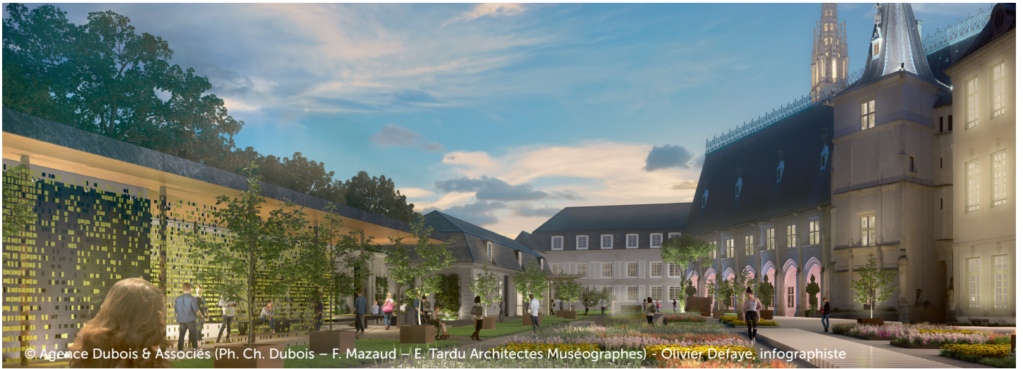
© Agence Dubois & Associés (Ph. Ch. Dubois – F. Mazaud – E. Tardu Architectes Muséographes) - Olivier Defaye, infographiste